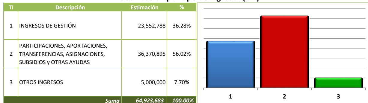
Clasificación por tipo de ingresos (CTI)